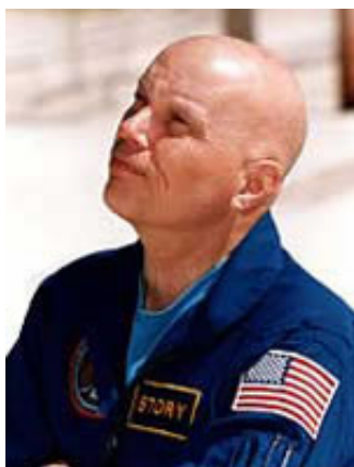
Story Musgrave (STS-80)

Dieser "Diskus" schien zunächst auf wundersame Weise wie aus dem "Nichts" aufzutauchen, flog durch darunter liegende Wolken und bewegte sich dann von rechts nach links, während die Astronauten es äußerst erstaunt anstarrten. Der äußere Rand des Fahrzeugs schien im entgegen gesetzten Uhrzeigersinn zu rotieren. Es war sehr groß (verglichen mit sonstigem "Weltraum-Müll" oder Eistrümmern), etwa 50 bis 150 Fuß um Durchmesser.