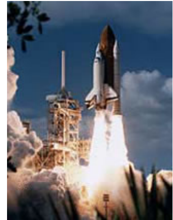
STS-80 Lift off from Pad 39B.

Space Shuttle "Columbia" nahm auf der "STS-80"-Mission eine Crew von fünf Astronauten zu einer Mission um die Erde mit, die 17 Tag, 15 Stunden und 54 Minuten dauerte, der längste Flug in der Geschichte dieses Raumfahrzeugs. Während diese ausgedehnten Flugs begab sich ein sehr seltsames Ereignis, das sogar Crew-Mitglied Dr. Story Musgrave, der es durch die Shuttle-Fenster beobachtete, nicht zu erklären in der Lage war.